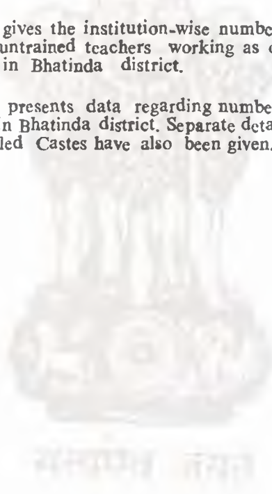
Table 12.3 presents data regarding number of students on roll on 15-5-1974 in Bhatinda district. Separate details of students belonging to Scheduled Castes have also been given.

Table 12.2 gives the institution-wise number of male and female trained and untrained teachers working as on 15.5.1974 in recognised schools in Bhatinda district.